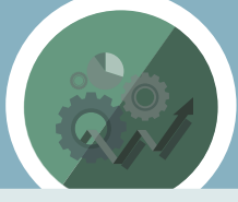
ကျောင်းစီမံခန့်ခွဲမှု