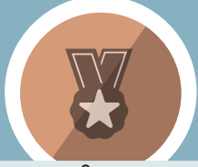
ကျောင်းသားများ အသိအမှတ်ပြုခံရမှု