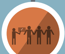
မိဘဆရာပူးပေါင်းပါဝင်မှု

ကျောင်းဆရာများမှာ အသိအမှတ်ပြုမှု မခံရသောကြောင့် မရေရာသော အနာဂတ်ဖြင့် ကြုံတွေ့နေရသည်။ ရွှေ့ပြောင်းကျောင်းဆရာများ အလုပ်ထွက်နှုန်း အလွန်မြင့်နေပါသည်။