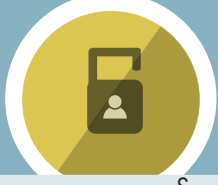
ကလေးကာကွယ် စောင့်ရှောက်ရေး