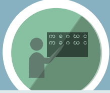
ဆရာ/မ များ အရည်အသွေးနှင့် ပံ့ပိုးမှု

ကျောင်းတိုင်းတွင် မိဘများပါဝင်တက် ရောက်သော အလှည့်ကျ အစည်းအဝေး များရှိပါသည်။